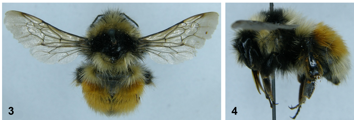
Рис. 3–4. Bombus (Pyrobombus) lapponicus (Fabricius, 1793), самка. 3 – вид сверху; 4 – вид сбоку.

Кормовые растения. Dryas oxyodonta Juz. (Rosaceae), Bergenia crassifolia (L.) Fritsch (Saxifragaceae), Hedysarum consanguineum DC. (Fabaceae), Pedicularis oederi M. Vahl (Scrophulariaceae).