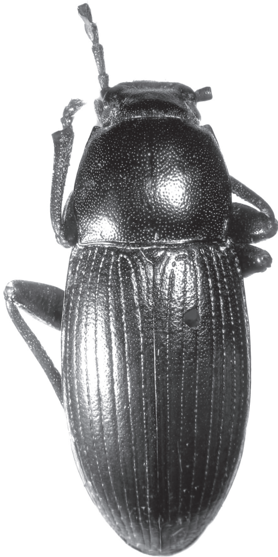
Рис. 1. Nalassus avaricus sp. n., голотип. Fig. 1. Nalassus avaricus sp. n., holotype.

представителей этого подрода: глаза слабо выпуклые и широко расставленные, передние углы переднеспинки острые, сильно выдаются вперед, волосяное пятно на 1-м абдоминальном стерните имеет V-образную форму, пунктировка на месте волосяного пятна грубая и редкая, точки продольно вытянутые.