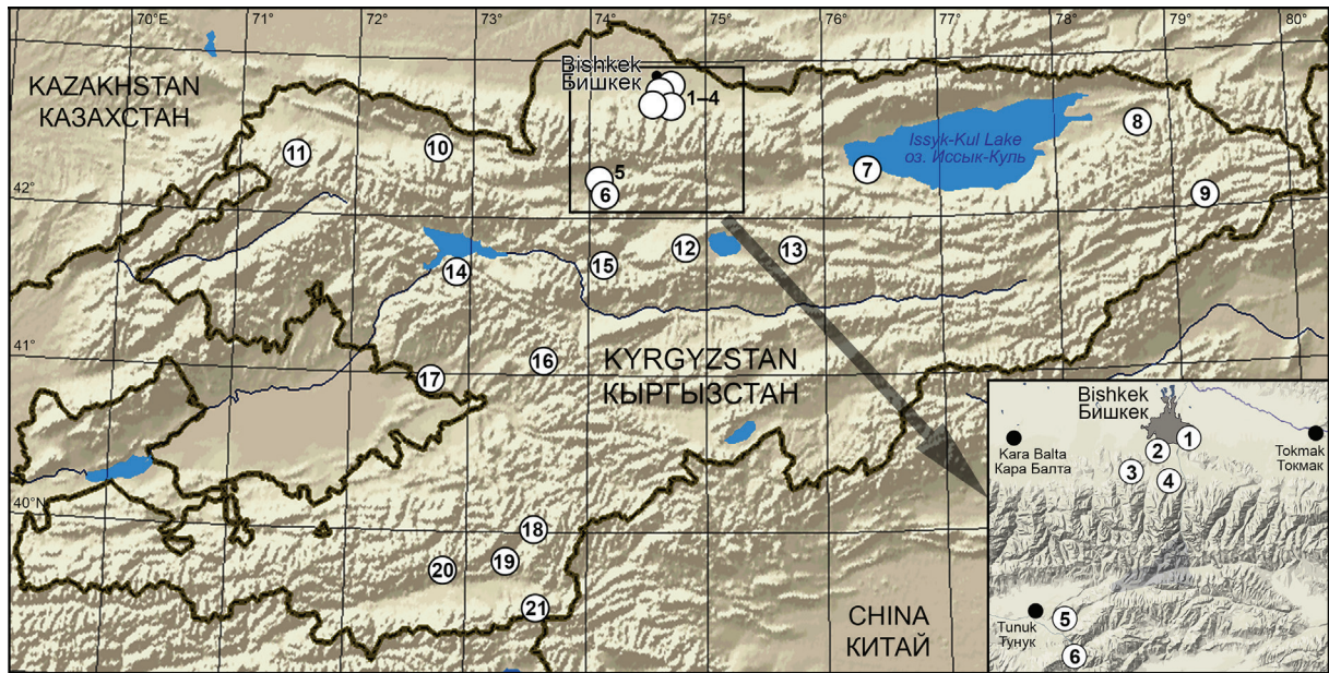
Fig. 1. Map of studied localities.