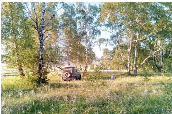
Рис. 4. Местонахождение Chrysopa viridinervis Jakowleff, 1869 на опушке Хвалынского леса, Саратовская область.

Fig. 4. The locality of Chrysopa viridinervis Jakowleff, 1869 at the edge of the Khvalynsk Forest, Saratov Region.