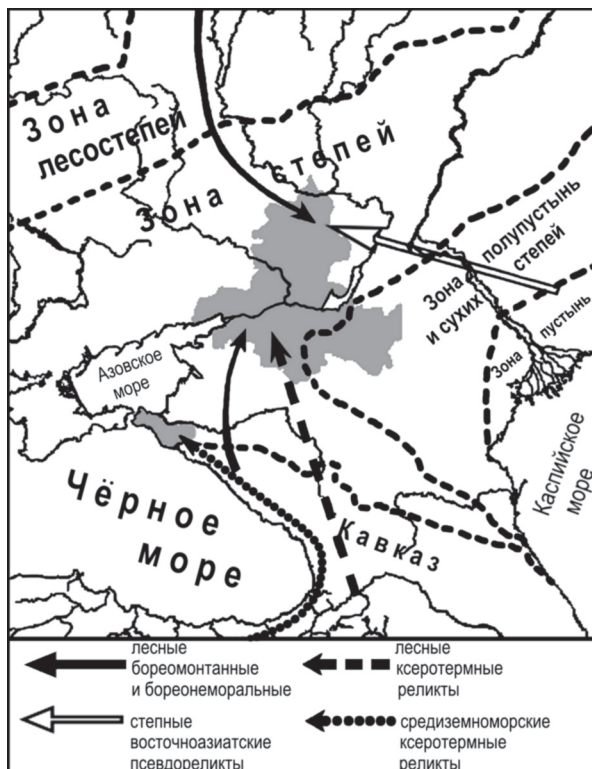
Рис. Родственные связи степной лепидоптерофауны Ростовской области и Краснодарского края с фаунами смежных природных зон Fig. Relationship of steppe Lepidoptera-fauna of the Rostov-on-Don and Krasnodar regions with faunas of adjacent natural zones.

в западном направлении и слияние ареалов азиатских степных форм с их эксклавными популяциями в степной зоне Европы. Соответственно, данная группировка утратит реликтовый характер, а ее значимость будет определяться не теоретическим аспектом (вклад в биоразнообразие), а сугубо практическим (расширение видового состава вредителей сельского хозяйства).