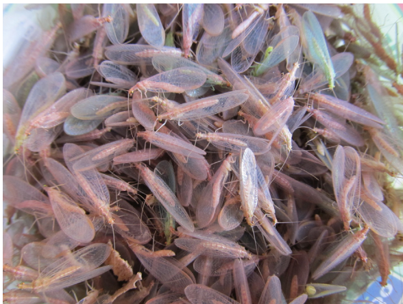
Рис. 14. Взрослые особи Chrysoperla carnea s. l. в зимней спячке. Fig 14. Hibernated adults of Chrysoperla carnea s. l.

Замечания. Европейско-азиатский массовый эвритопный вид. Обитает в различных биотопах, в том числе в агроценозах, в садах, в широколиственных лесах, на перелесках, на пойменных лугах, в парках и т.д. Встречается как на лиственных и хвойных деревьях, так и на траве и кустарниках. Личинки питаются мелкими насекомыми, в то время как имаго – палинофаги, а также могут питаться сладкими выделениями тлей. Лёт имаго наблюдается в течение всего вегетационного периода. С похолоданием взрослые особи мигрируют с открытых пространств в близлежащие леса и здания и прячутся в дуплах и под корой деревьев, в заброшенных гнездах, в ульях, под подоконниками в квартирах, в оконных щелях, на чердаках, на балконах, образуя, как правило, большие скопления. Это объясняет появление имаго на балконах и в помещениях после оттаивания оконных стекол весной, а также после включения отопления осенью, когда вид готовится к зимовке. При этом Ch. carnea s. str. в поиске мест для зимовки способен преодолевать значительные расстояния. Зимующие особи чаще всего меняют окраску тела на красновато-бурый («мясной») цвет. Яйца в кладке располагаются изолированно друг от друга. Дает от двух до пяти генераций в год. Имаго летят ночью на свет.