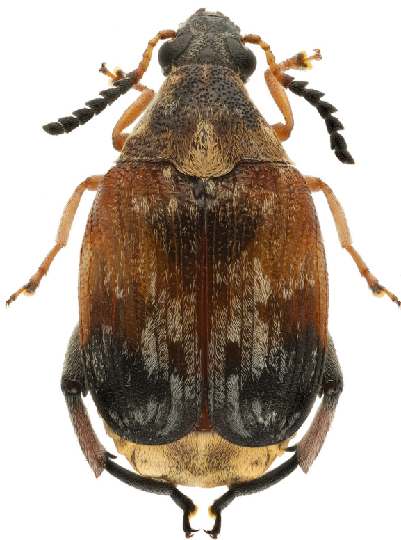
Рис. 1. Megabruchidius tonkineus , общий вид имаго, самец. Fig. 1. Megabruchidius tonkineus , general view, male.

Биология. В условиях нативного ареала в качестве кормового растения M. tonkineus указан вид Gleditsia australis F.B. Forbes et Hemsl., плоды и семена которого широко используются во Вьетнаме для промышленного и кустарного производства средств по уходу за волосами и кожей головы. Предполагают, что одним из векторов инвазии M. tonkineus в Европу мог быть завоз пораженного растительного материала вьетнамскими рабочими, массово эмигрировавшими в Восточную Европу в 1970–1980 годы [Delobel, Delobel, 2008]. В пределах вторичного евро-азиатского и африканского ареала развитие личинок M. tonkineus было отмечено в семенах североамериканского интродуцента Gleditsia triacanthos L. [Jermy et al., 2002; György, 2007; Stojanova, 2007; Delobel, Delobel, 2008; Yus Ramos, 2009; Gavrilović, Savić, 2013; Rheinheimer, 2014; Kurtek et al., 2017; Yus Ramos, Carles-Tolrà, 2017; Pintilioaie et al., 2018; Salgado Astudillo, 2021; Šipek et al., 2022; Inan, Hizal, 2023]. В то же время в Аргентине зарегистрировано развитие личинок M. tonkineus в семенах южноамериканского вида Gleditsia amorphoides (Griseb.) Taub. [Di Iorio, 2015].