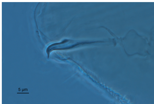
Рис. 1. Эдеагус Oligonychus lagodechii . Fig. 1. Aedeagus of Oligonychus lagodechii .

Основные результаты исследования фауны паутиных клещей для территории бывшего СССР были обобщены более 30 лет назад с акцентом на Закавказье и Крымский полуостров [Митрофанов и др., 1987]. Сведения о фауне Tetranychidae территории Черноморского побережья Краснодарского края крайне скудны. Данный регион по своим экоклиматическим характеристикам является благоприятным для вселения многих видов инвайдеров, в том числе паутиных клещей. Поэтому актуализация сведений о фауне Tetranychidae Черноморского побережья Краснодарского края представляется важной как для изучения биоразнообразия, так и для мониторинга фитосанитарного состояния региона.